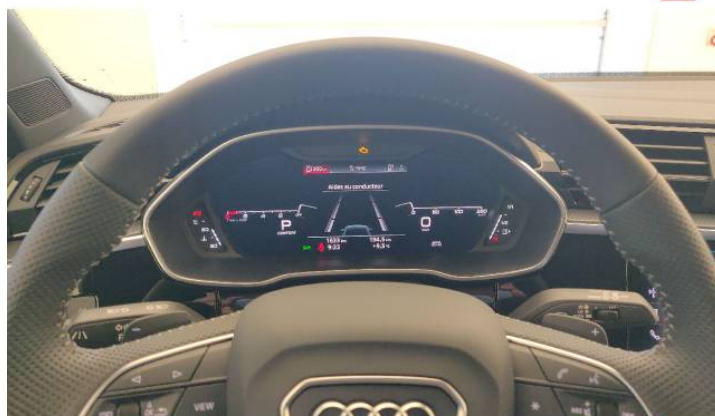
Audi Occasion :plus