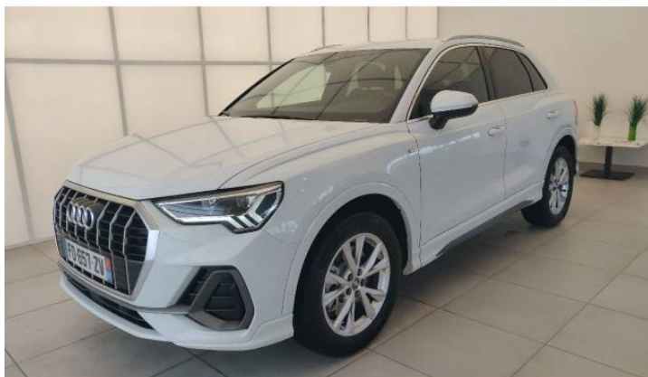
Audi Occasion :plus